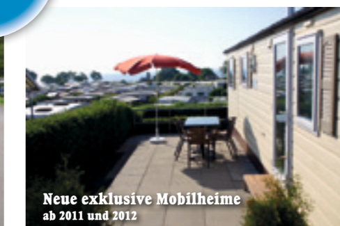
Neue exklusive Mobilheime ab 2011 und 2012